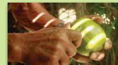
La cáscara se raspa con un cuchillo.