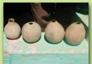
Semillas de higüero secas, listas para rellenar.