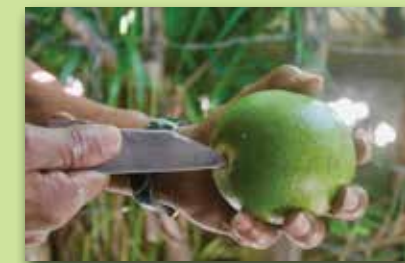
Con un cuchillo se hace un hoyo a la semilla de higüero.