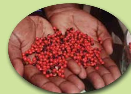
Las semillas de cuquillito o peonia vienen de una planta trepadora llamada bejuco.