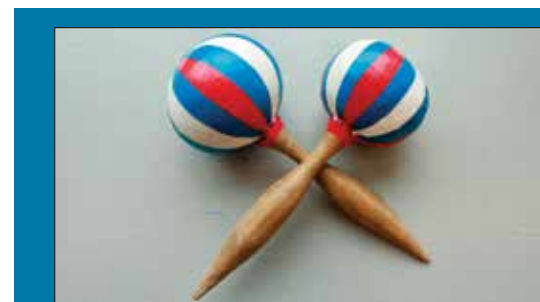
A Gregorio le gusta pintar sus maracas con colores patrióticos.

El mango se hace con un pedazo de palo de escoba, afilado por la parte de arriba y más grueso por la parte de abajo. El palo se pega con coquí. Por último, se pintan las maracas con pintura uñas con el diseño que uno quiera.