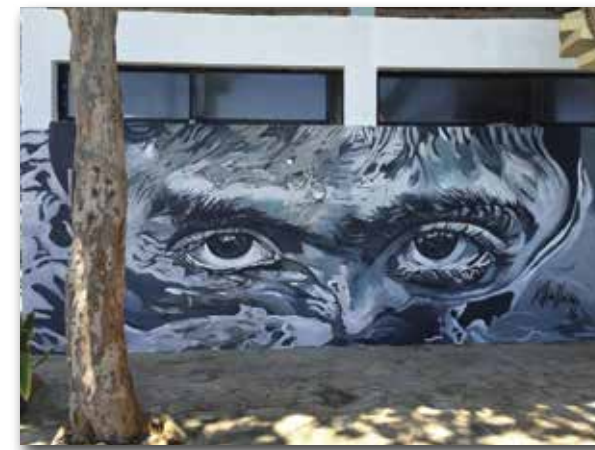
Este mural de Kilia está en Kite Beach.

El grafiti se considera arte urbano, es decir, es un tipo de arte urbano. No todo el que pinta en la calle es grafitero. El grafiti es un lenguaje particular muy gráfico que implica letras, mensajes o lo que se conoce en el mundo grafitero como "tags" o firmas. En este tipo de arte es importante difundir mensajes y establecer territorios. Muchos incluso están muy ligados a las bellas artes y se valen de métodos de pintar tradicionales pero manteniendo ese aire de arte callejero en esencia.