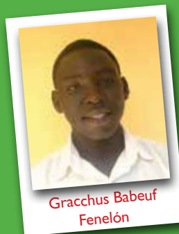
Gracchus Babeuf Fenelón