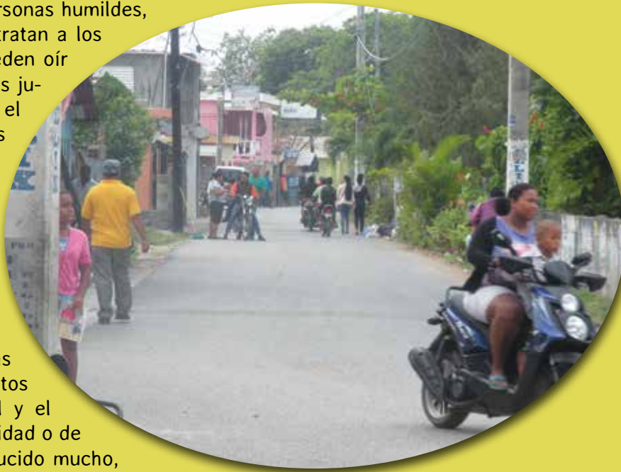
La entrada de la Ciénaga

Las personas de la Ciénaga son solidarias. Al igual que en muchas comunidades, la delincuencia ha sido uno de los principales problemas que afectaban a la comunidad. Ha habido pleitos y robos inesperados, pero gracias al control y el trabajo ejercido por los dirigentes de la comunidad o de la junta de vecinos, la delincuencia se ha reducido mucho, aunque todavía nos queda mucho trabajo por resolver. Entre todos podemos conseguirlo.