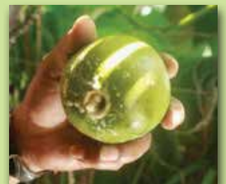
Por el hoyo se sacan las tripas.